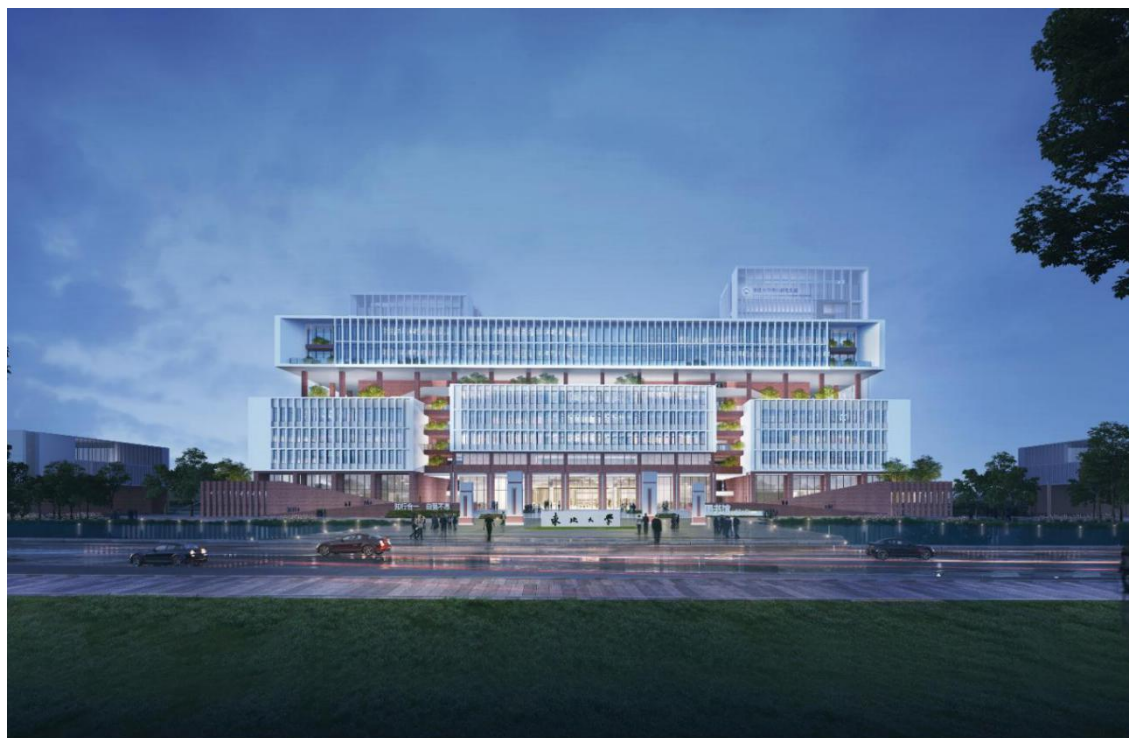
学习综合体效果图

东北大学坐落在东北中心城市辽宁省沈阳市，是教育部直属国家重点大学，是国家首批“211 工程”和“985 工程”重点建设高校。2017 年 9 月，经国务院批准，进入一流大学建设高校行列。